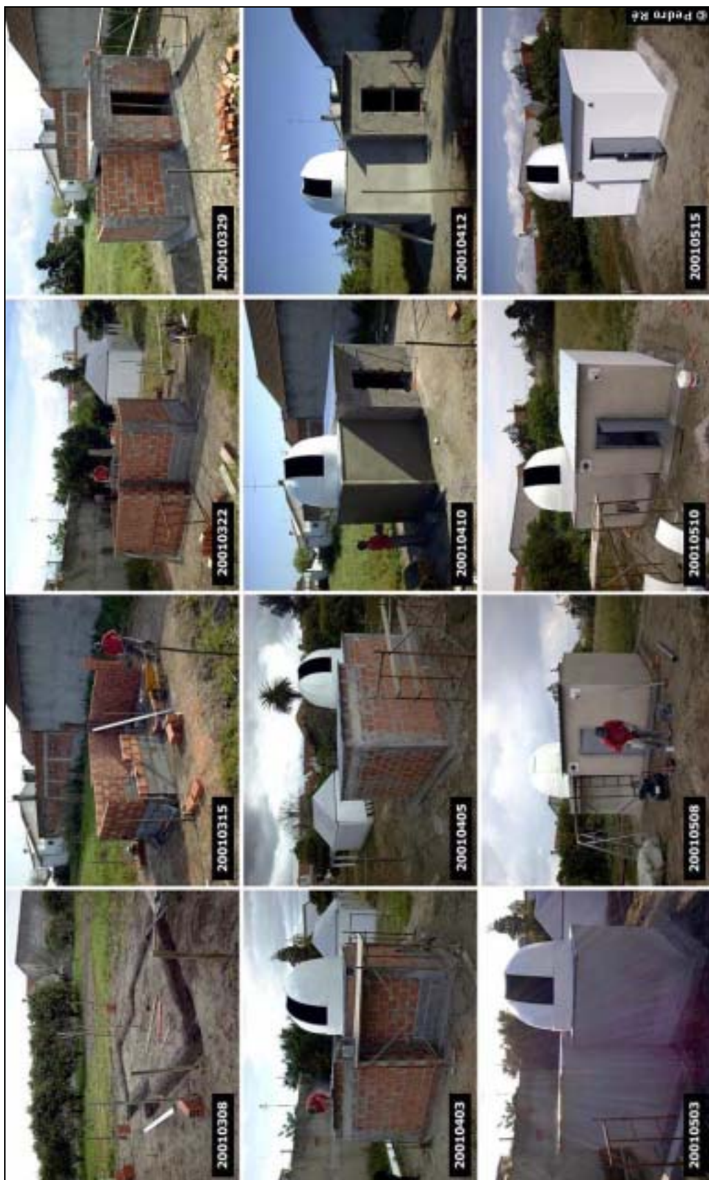
Figura 5- Observatório de Pedro Ré (cúpula construída por Marcelo Jorge). http://www.astrosurf.com/re/dome.html