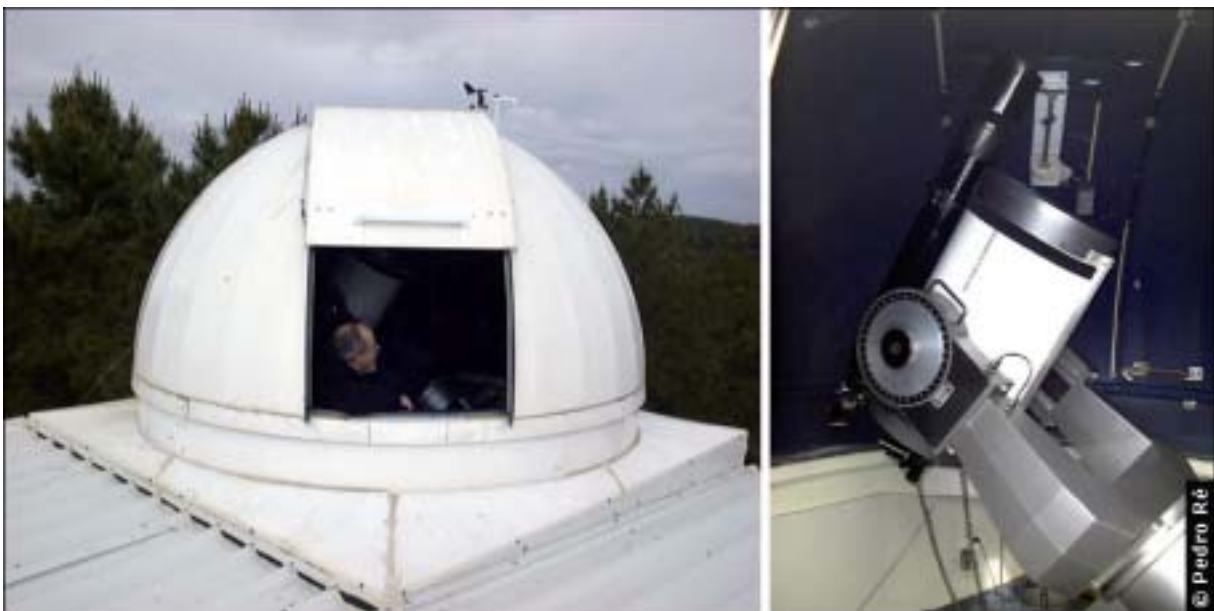
Figura 8- Observatório da ANOA. Cúpula robótica e LX200 16". http://www.anoa.pt/