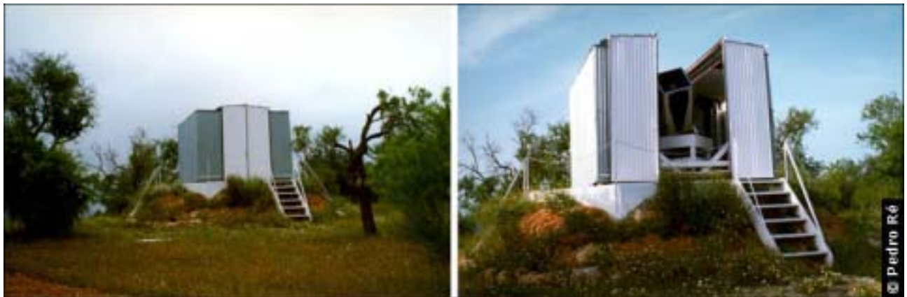
Figura 3- Observatório astronómico de Tavira, CDEPA. http://www.cdepa.pt/