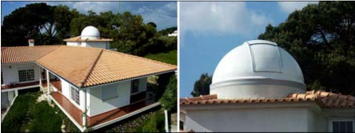
Figura 6- Observatório de Carlos Oliveira. http://www.astropor.com/cloco/