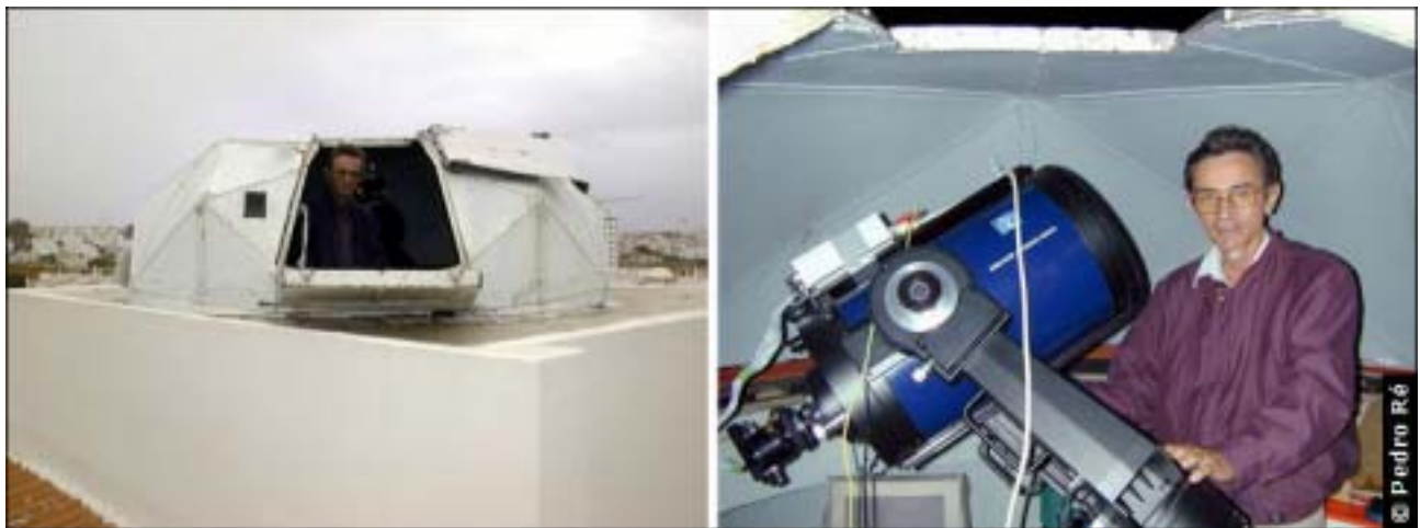
Figura 4- Observatório de Fernando Tonel. http://members.tripod.com/~TonelF/