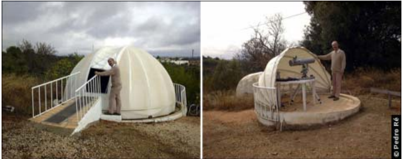
Figura 2- Observatório do COAA (Centro de Observação Astronómica no Algarve). http://www.ip.pt/coaa/index.htm