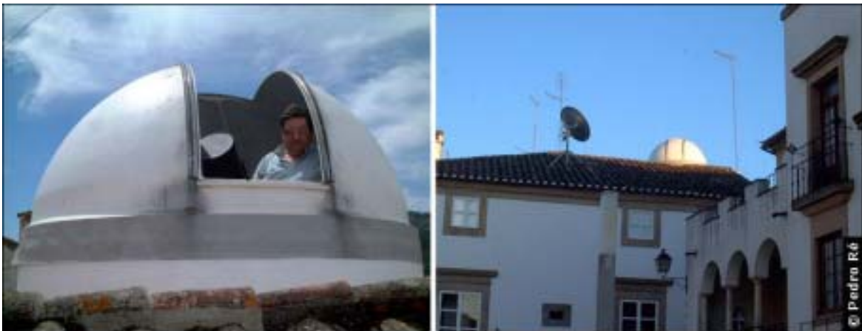
Figura 7- Observatório de Acácio Lobo. http://astrosurf.com/acaciolobo/